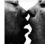
Nitrate Kisses (1992)