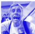
Caminhada Lésbica por Marielle (2018)