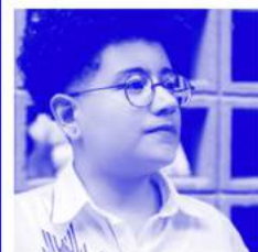
Cecília Floresta Escritora